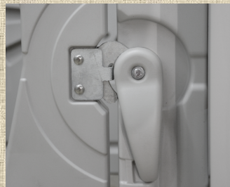
安全で握りやすい ロックハンドルで開閉楽々