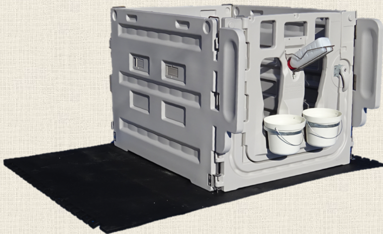
通路用ゴムマット*とカーフペンの併用使用例