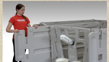
中央のパネルを取り外して グループ・ペンに早変わり