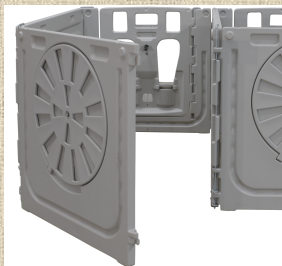
リアパネルも開閉可能